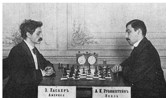
Fotografia dokumentuje jedyną w historii partię szachów rozegraną przez Emanuela Laskera i Akibę Rubinsteina. Grali w Petersburgu w 1909 roku. Wygrał Rubinstein.

Zmarł w 1961 roku, w domu starców w Antwerpii. Kompletnie zapomniany przez świat geniusz, jeden z największych mistrzów wszechczasów.