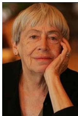
Ursula K. le Guin

https://www.marvellous-provence.com/arts-and-traditions/literature/the-marseille-caper-by-peter-mayle