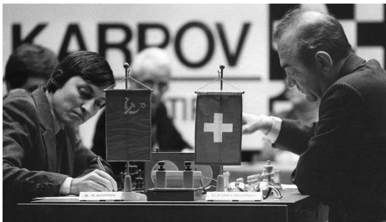
Anatolij Karpow i Wiktor Korcznoj podczas meczu o tytuł mistrza świata